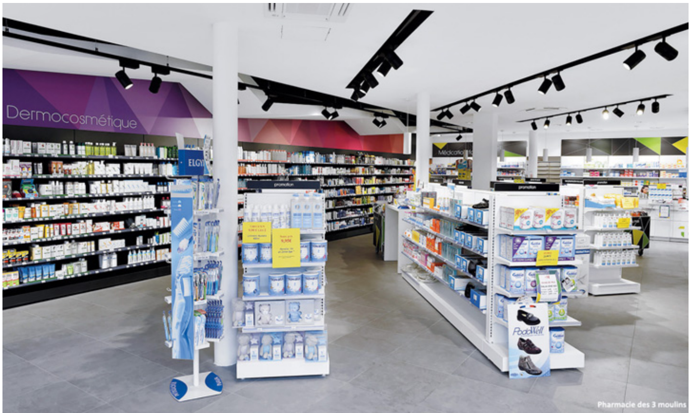
Pharmacie des 3 moulins